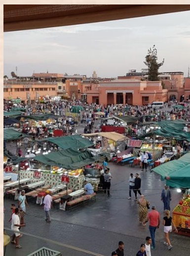
de markt verandert langzaam in open eettent