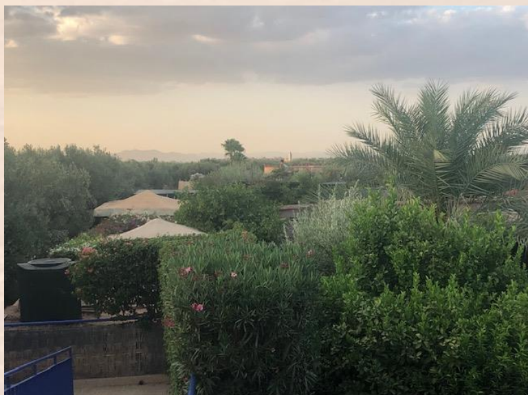
Impressies van ons dakterras.