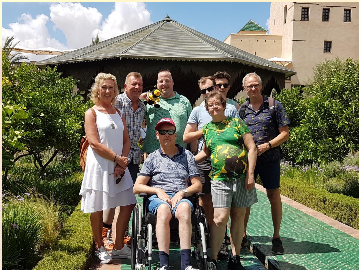
De geheime tuin in het centrum van Marrakech