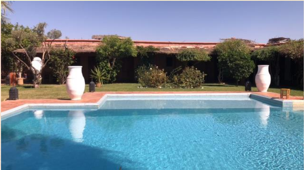
hmmmm, wilt u de zonnebrand ff doorgeven?